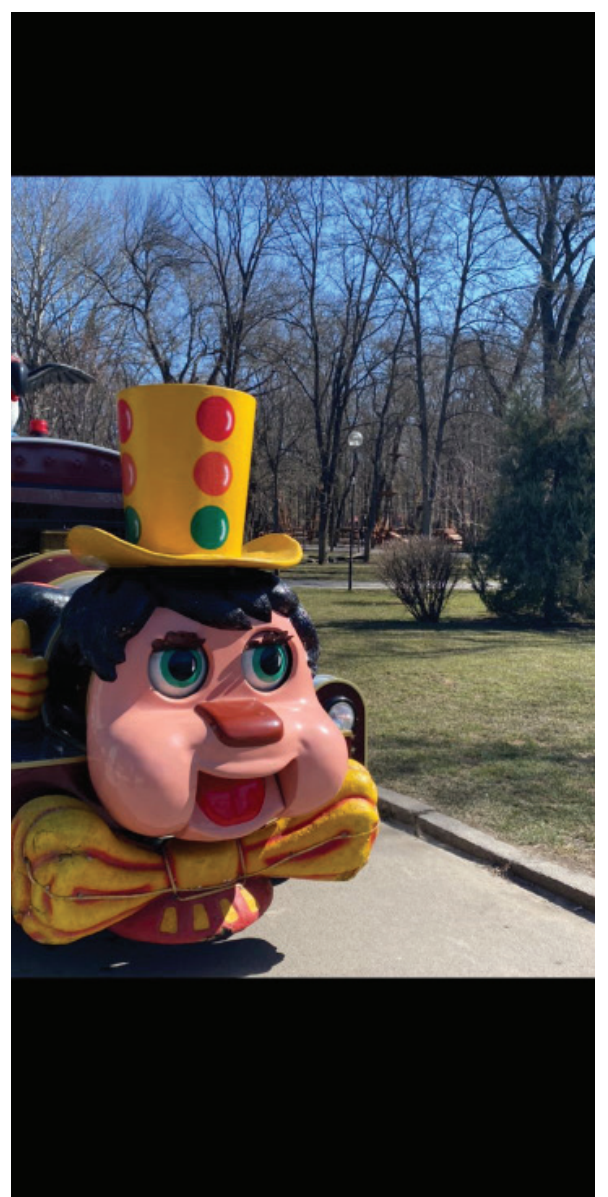
ПОЕЗД ИЗ РОМАШКОВО.