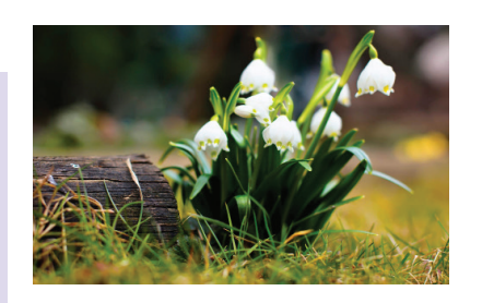
«ЮНКОРЫ НА ВЕСЕННИХ ТРОПИНКАХ»

Солнечным мартовским днем детским медиацентром «Контакт» Пролетарского района было проведено мероприятие: поход в ЮОВС – Южный Окружной Военный Суд.